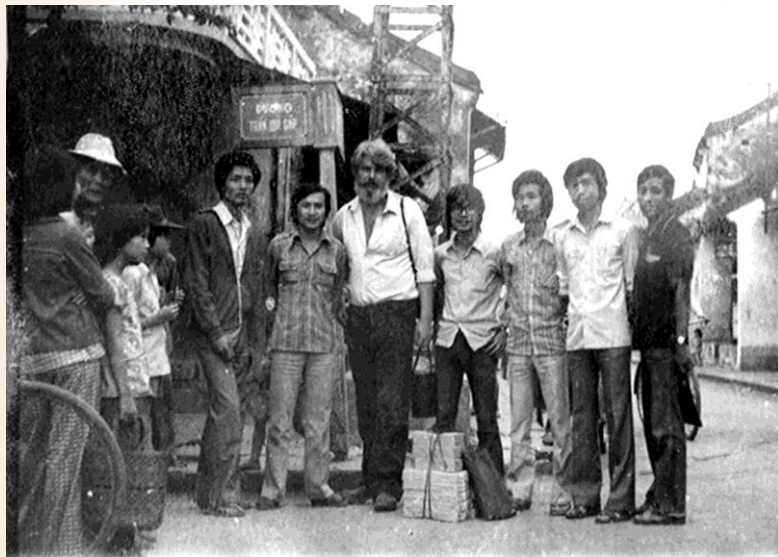
Kazimierz Kwiatkowsky, người thứ 5 từ phải sang chụp hình kỷ niệm khi khảo sát phố cổ Hội An

ban hợp tác Ba Lan - Việt Nam tu bổ di tích Mỹ Sơn, kiến trúc sư người Ba Lan - Kazimierz Kwiatkowsky, tên thân mật là