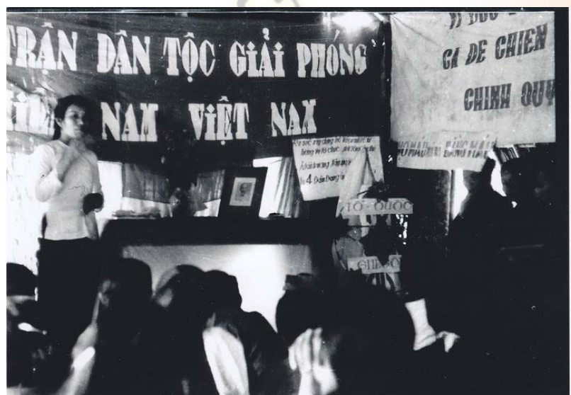
Đội quân chính trị học tập chuẩn bị cho Tổng tiến công và nổi dậy Tết Mậu Thân - 1968, ảnh trưng bày tại Bảo tàng Hội An

Lực lượng quần chúng khởi nghĩa được lệnh chuyển sang làm nhiệm vụ tiếp tế hậu cần, tải thương, giải quyết chiến trường, phục vụ cho bộ đội rút quân. Trong bom đạn ác liệt, đồng bào huy động mọi lực lượng và khả năng có được để tổ chức chôn cất liệt sĩ, tham