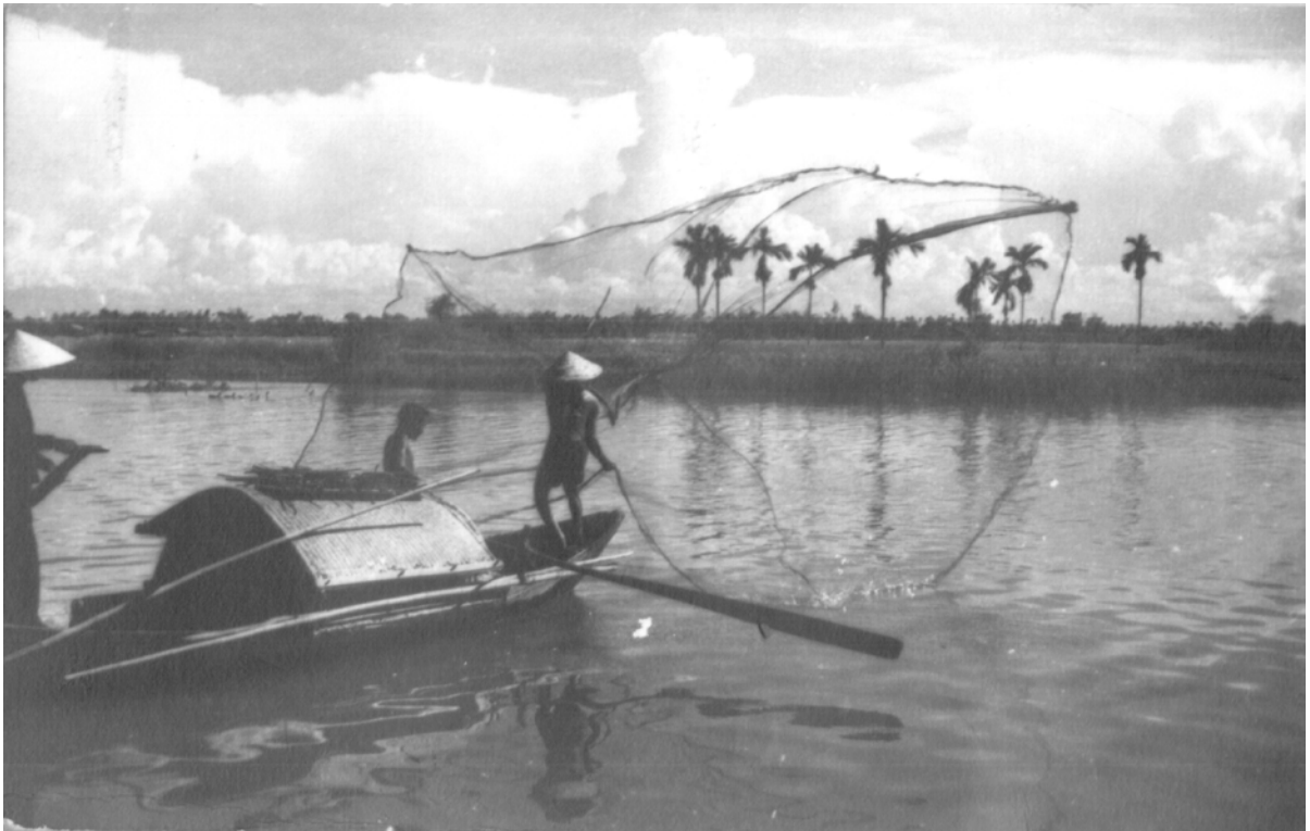
Vải chài